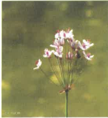
Butome à ombelle